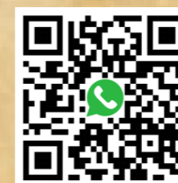
Whatsapp Municipal 667 548 483