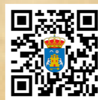
Web Municipal www.alanis.es