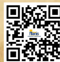
Jornadas Medievales medieval.alanis.es