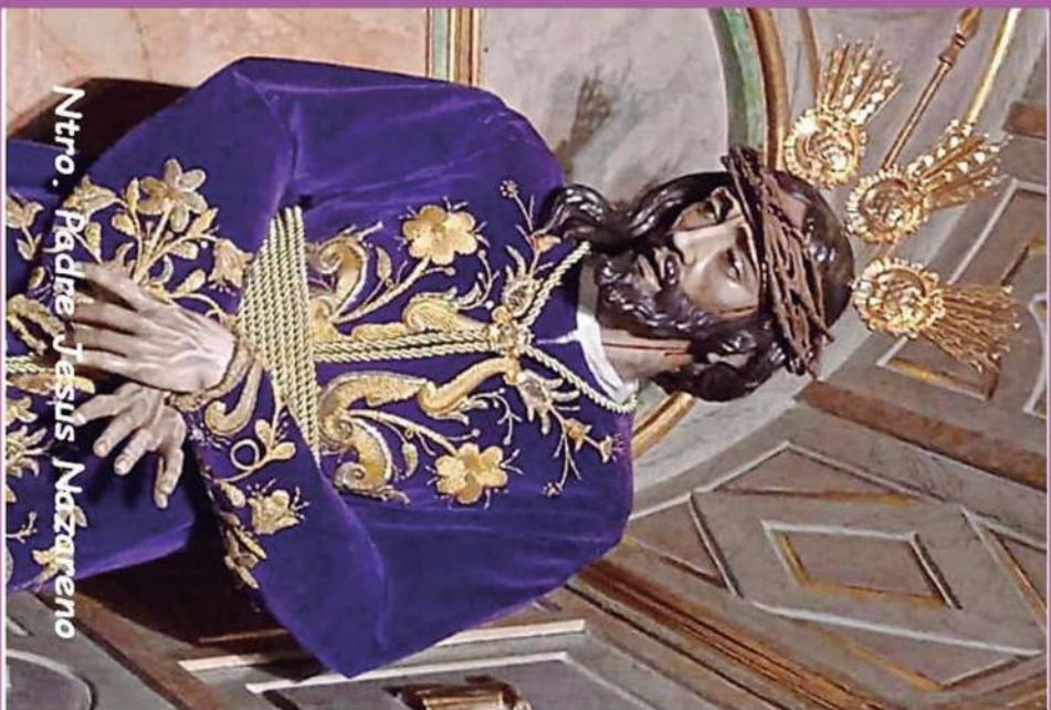
Ntro. Padre Jesús Nazareno