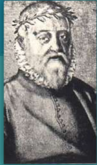
Baltasar del Alcázar