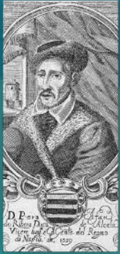
Per Afán de Ribera

El Castillo es el núcleo primitivo en torno al cual se fue formando la actual población de Los Molares. Data de principios del siglo XIV, cuando el rey Fernando IV concede el lugar a Lope Gutiérrez de Toledo como premio a su actuación en la batalla de Algeciras.