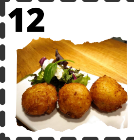
BAR PACHECO. CORDERO INFANTE FELIPE