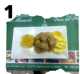
MESÓN DEL MORO. CORDERO CON MANZANA