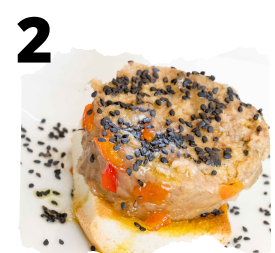
POSADA DEL MORO. PATÉ DE CORDERO ENVUELTO EN VELO LECHAL