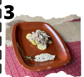
LAS BANDERAS. MIGAS DE LA CASA REAL