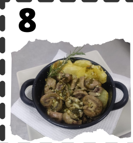
EL PIÑERO MARI COBOS. RIÑONES DEL CARDENAL