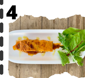
RESTAURANTE VISTALEGRE. PASTEL DE CORDERO CON QUESO