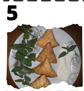
EL RINCÓN DEL GALLO. MANJAR PLEBEYO