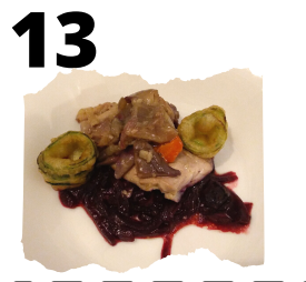
EL TORERO. "A MI MANERA"