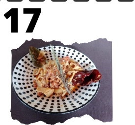
MESÓN LA JARA. "JARA REAL"