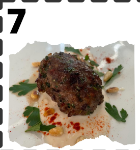
PATRILLIN. POLPETTA DEL ANIMOSO