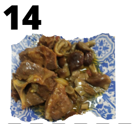
BAR FALI. CORDERO AL MARQUÉS DE ROCHA