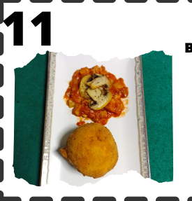
PEÑA BÉTICA. BOMBA DE CORDERO AL FELIPE V