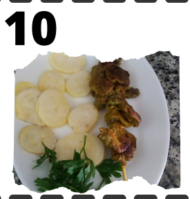
LA GALLINA. PINCHO GALLINERO REAL