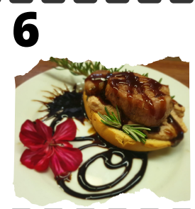
MESÓN LA BOLERA. FLOR REAL DE CAZALLA