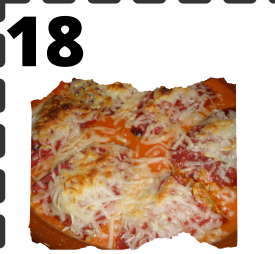
LA CANALLA. PIMIENTOS DE CORDERO A LA PARMESANA