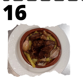
CASA KINI. CORDERO FRITO AL AJILLO